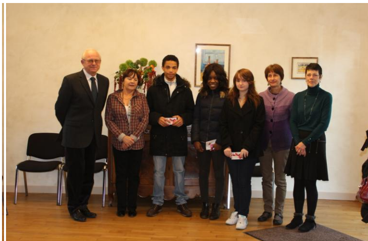
Les jeunes de 16 ans et le CCAS

Rappelons que le recensement obligatoire à 16 ans est une démarche civique essentielle. Ces jeunes gens effectueront la journée de préparation à la défense. Troisième étape du « parcours de citoyenneté ». Cette journée est l'occasion de découvrir les métiers de la Défense mais surtout de leur rappeler qu'en tant que citoyens libres, ils ont des droits et des devoirs dans le respect du droit d'autrui.