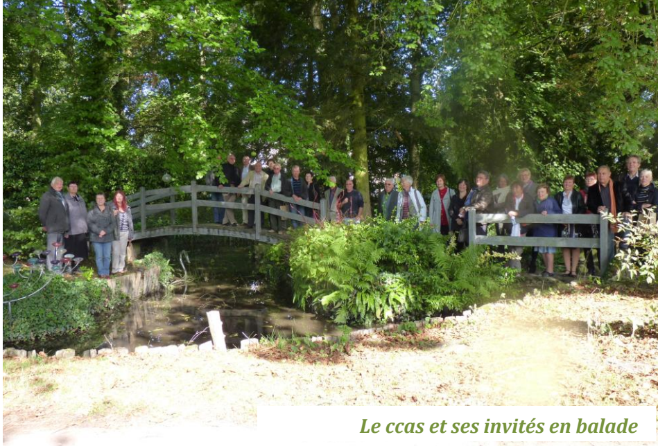
Le ccas et ses invités en balade

Bulletin d'information – n° 22 décembre 2012