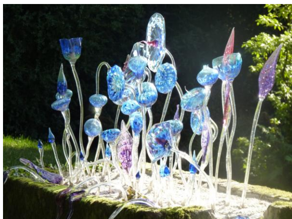
Jardin de verre